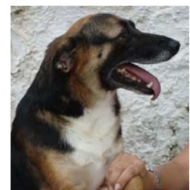
Alpha - 4 anos

Produção artística: Simone Tavorolo Luisada