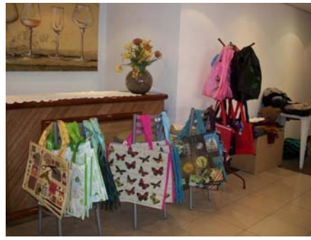
Produtos vendidos no Chá Beneficente no Ed. San Thomaz