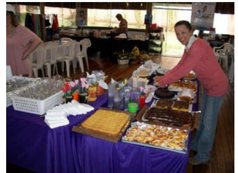
Chá beneficente em parceria com a Associação Girassol

A equipe do Aubrigo Franslázaro agradece imensamente a todos que contribuíram para os Chás Beneficentes, Brechós e Bazar realizados em prol da nossa causa. Um obrigada especial à Associação Girassol, equipe de voluntariado, residenciais Alphavilles 1, 10 e 12 e condomínio San Thomaz.